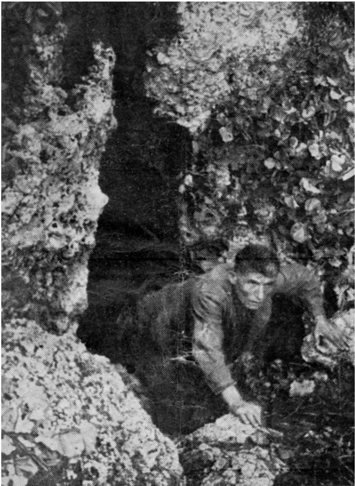
Η Σπηλιά του Μαρτυρίου όπως ήταν το 1945, λίγο μετά το Ολοκαύτωμα.