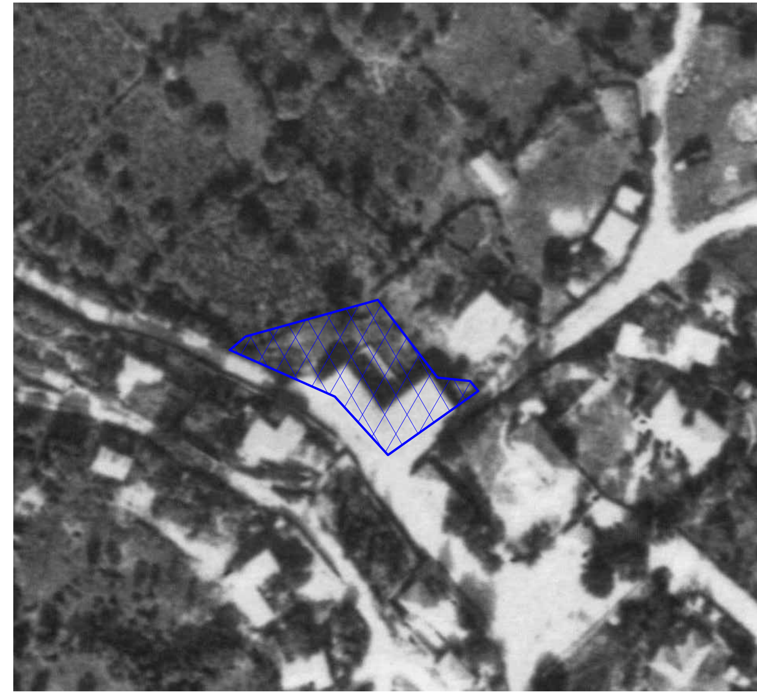
ΑΠΟΣΠΑΣΜΑ ΑΕΡΟΦΩΤΟΓΡΑΦΙΑΣ ΟΡΙΘΜΕΤΗΣΗΣ ΟΙΚΙΣΜΟΥ ΝΕΓΡΑΔΩΝ ΙΩΑΝΝΙΝΩΝ