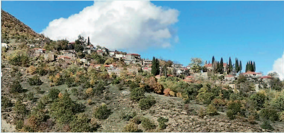
Χλωμό, το αρχοντοχώρι του Παγωνίου - Αργυροκάστρου.