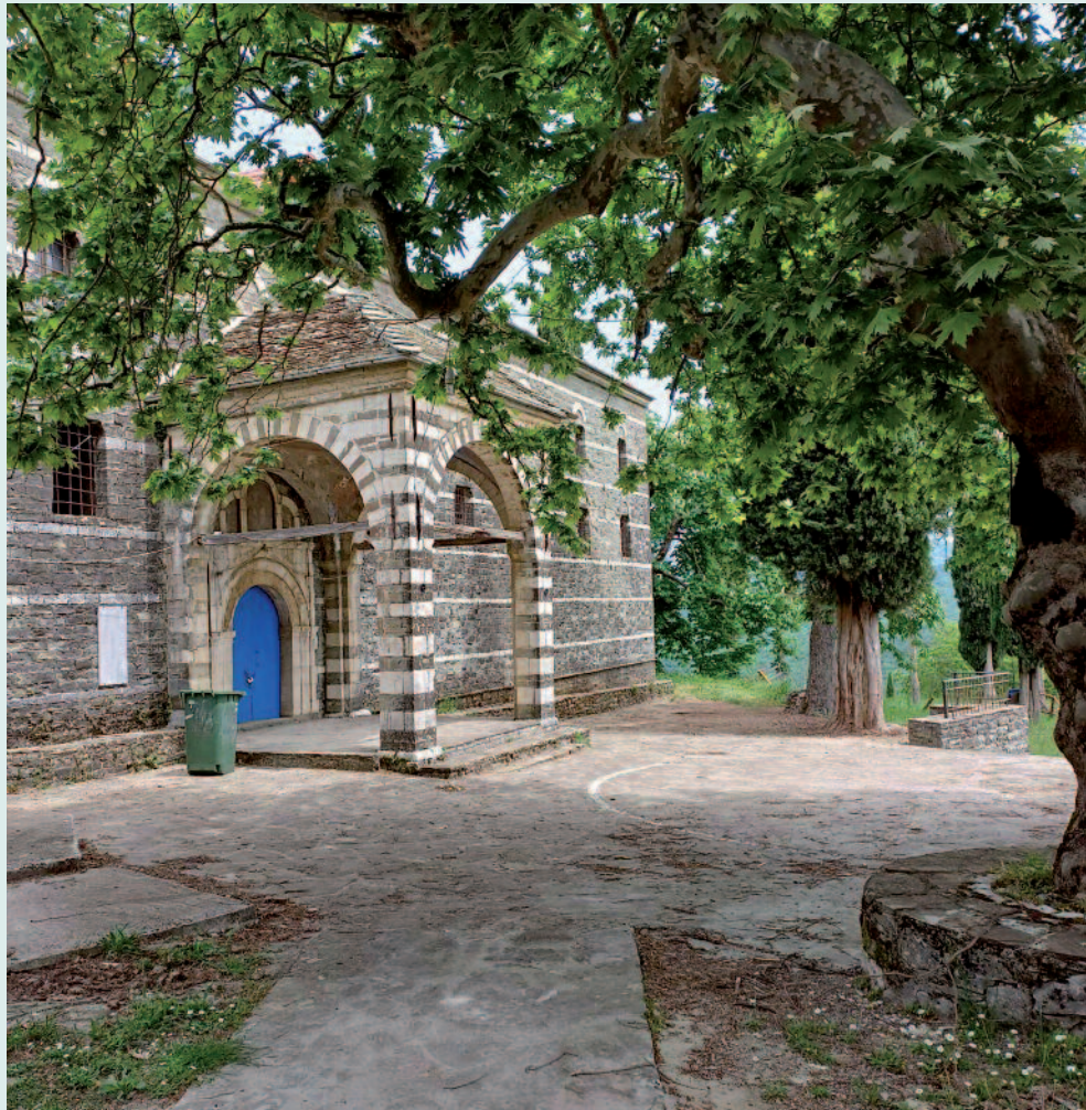
Ο περικαλλής Ναός Αγ. Παρασκευής Χλωμού, με το περίφημο ηλιακό ρολόι, έργο των εν Κωνσταντινουπόλει Αποδήμων.